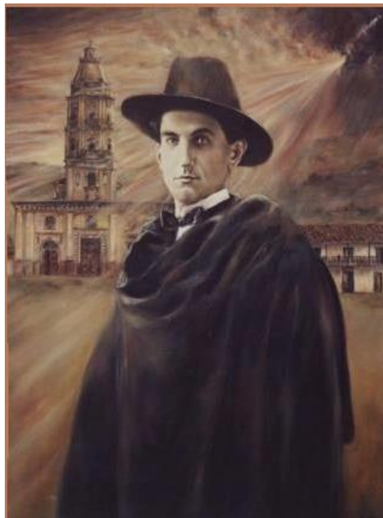
Ciro Mendía . Obra de Dorian Flórez. 2001. Óleo sobre tela. 150x120.

Así describía Ciro Mendía su natal municipio de Caldas en su libro Fin de Fiesta de 1972, versos que recogen en pocas líneas el trasegar histórico de esta localidad al sur del valle de Aburrá. Cuna industrial de la cerámica, hogar de artistas, músicos y escritores, Caldas es un lugar bañado por la lluvia que le ha merecido el apodo de Cielo Roto y que celebra este elemento con sus ya tradicionales Fiestas del Aguacero. En memoria de la vida y obra de este escritor, el municipio realiza este año la versión XXVII del Premio Latinoamericano de Poesía Ciro Mendía .